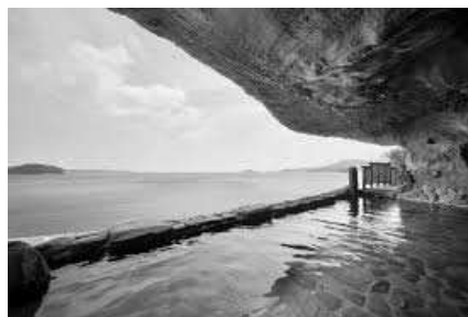
サンマリン気仙沼ホテル観洋