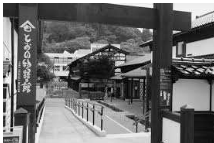
とのおの物語の館